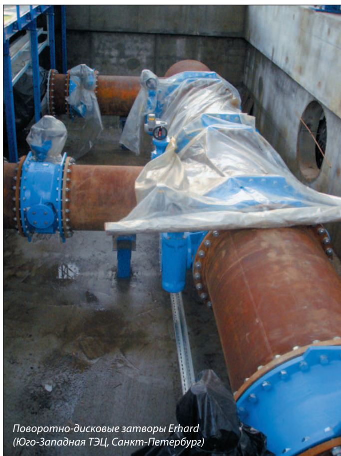
Поворотные-дисковые затворы Erhard (Юго-Западная ТЭЦ, Санкт-Петербург)

Благодаря крупнейшему в Европе складскому комплексу компании «СЕВКОМ» всегда в наличии большой ассортимент продукции. Емкость склада составляет 1000 паллетомест. Складские помещения позволяют хранить трехмесячный запас оборудования, а отлаженная работа логистики — поставлять его на объекты в кратчайшие сроки. Кроме того, склад имеет отличную транспортную доступность — он расположен рядом с КАД, что минимизирует возможные временные затраты.