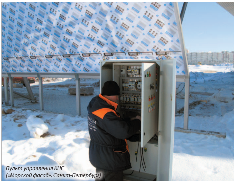
Пульт управления КНС («Морской фасад», Санкт-Петербург)

Компания «СЕВКОМ» более 16 лет занимается поставками на российский рынок водозапорного оборудования таких известных европейских производителей, как Erhard, Hawle, Krammer, Raphael, Pom Marlener . За это время организация выполнила тысячи успешных поставок по всей стране. Мы понимаем, что бережное обращение с таким важным ресурсом, как вода, гарантирует-