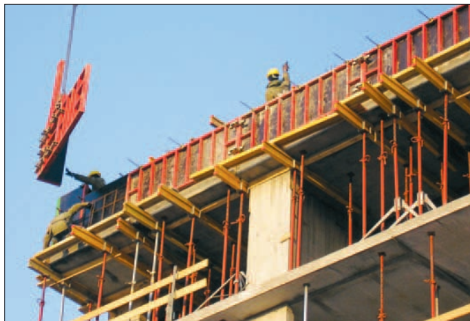
Проблема безопасности рабочих мест актуальна и для Италии.