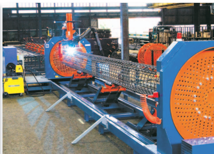
▲ Pilemaster — машина для сварки арматурных каркасов свай с винтовой навивкой проволоки