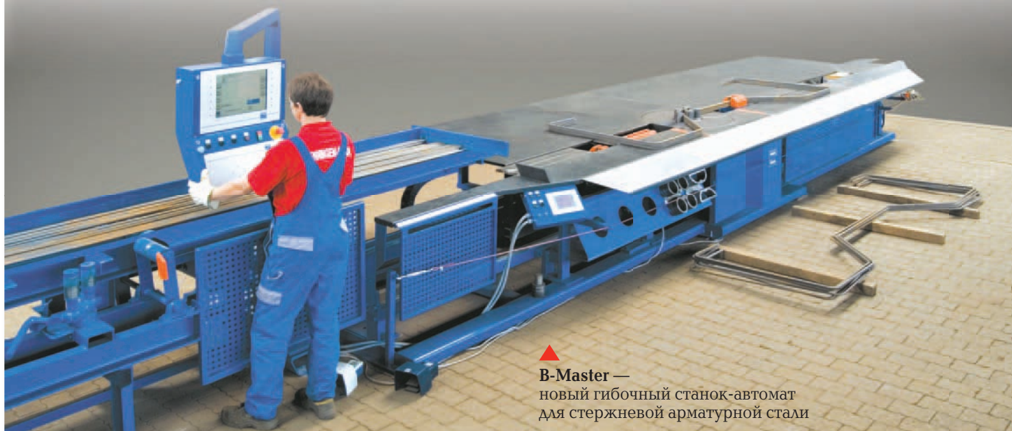
▲ B-Master — новый гибочный станок-автомат для стержневой арматурной стали