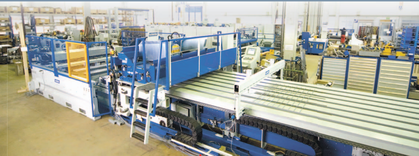
Система MG – 208 для производства легких и тяжелых стандартных арматурных сварных сеток