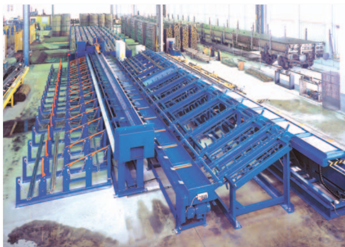
▲ Comblin — комплекс для резки и гибки стержневой арматурной стали