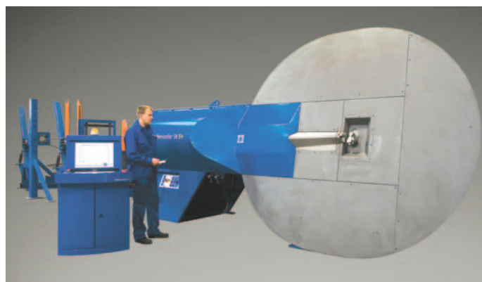
▲ Twinmaster 16X+ — гибочный автомат с сервоприводом

Н емецко-датская компания Stema/Pedax с 1926 г. выпускает высокопроизводительное и надежное оборудование для обработки арматурной стали и проволоки. Машины и автоматы Stema/Pedax выполняют правильные, гибочные и отрезные операции, а также предназначены для производства пространственных каркасов для колонн и свай со спиральной навивкой поперечной проволоки и обработки сварных сеток. В производственной программе есть как небольшие отдельно работающие машины, так и высокопроизводительные, полностью скомплектованные и автоматизированные арматурные участки. Арматурная сталь может быть стержневой и из бухты. Диаметр — от 5 до 60 мм, предел текучести — 700–850 Н/кв. мм. Скорость подачи обрабатываемого материала достигает 120–180 м/мин.