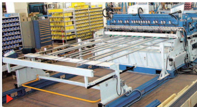
Система MG – 210 для производства легких и тяжелых стандартных, а также специальных арматурных сварных сеток