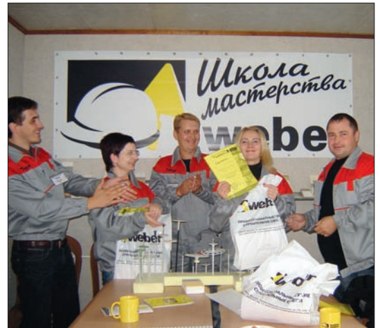
Школа мастерства Weber Vetonit

тренингов получают возможность поработать с материалами своими руками, произвести монтаж строительных элементов и узлов под руководством квалифицированных специалистов. Добро пожаловать на тренинги!