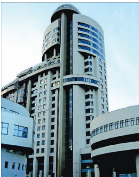
Жилой дом в г. Екатеринбурге (фасады Weber Vetonit)

Дополнительную информацию о компании см. на 4-й обложке