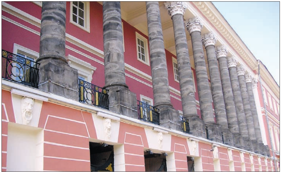
Екатерининский дворец в Лефортово (внутренняя отделка стен и потолков Weber Vetonit)

Концерн «Сен-Гобен» входит в TOP-100 промышленных корпораций мира. В рамках концерна существует несколько бизнес-направлений. Сектор «Сен-Гобен Строительная Продукция» — один из самых крупных в концерне и составляет более 23% в общем обороте компании.