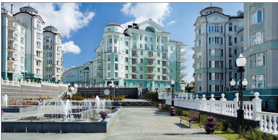
Жилой комплекс «Покровский берег» (фасады Weber Vetonit)