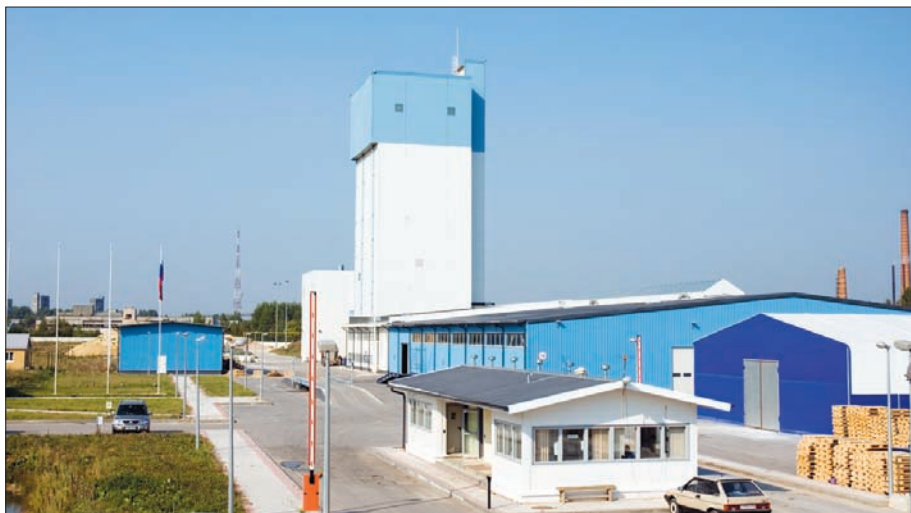
Завод в г. Арзамасе

лидер рынка во Франции и Южной Европе, имеет очень хорошие позиции в Восточной Европе, в то время как Maxit — лидирующий игрок на рынках Германии и Скандинавии. Сегодня эти марки представлены более чем в 35 странах мира.