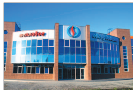
Завод теплового оборудования (г. Тосно, Ленинградская область)

2 Характеристики сэндвич-панелей, представленные в статье, получены в результате сертифицированных испытаний, проведенных компанией «Армакс».