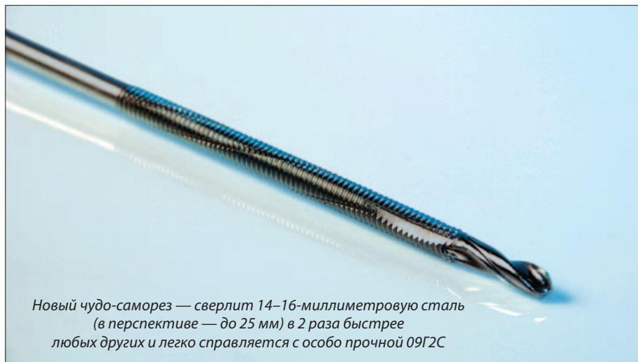
Новый чудо-саморез — сверлит 14–16-миллиметровую сталь (в перспективе — до 25 мм) в 2 раза быстрее любых других и легко справляется с особо прочной О9Г2С

Наверное, некоторая агрессия, заложенная в названии бренда Нагрооп, нашла выражение в стремительности и натиске, который продемонстрировала компания «Глобал Ривет» при запуске продукции этой марки на российский рынок в феврале 2006 г. Бренд скоро стал настолько узнаваем, что «Гарпуны» вошли в отраслевой словарь каждого монтажника вентилируемых фасадов от Москвы до самых.... Причем вопреки многим, казалось бы, объективным факторам. В первую очередь — китайскому происхождению. Стереотип «китайской дешевки» растаял, как утренний туман, когда первые «Гарпуны» стали входить, как нож в масло, в фасады новостроек столицы. Сегодня Нагрооп надежно держит фасады престижнейших объектов, таких, как новый учебный корпус МГУ, выставочный комплекс «Экспоцентр», железнодорожный терминал аэропорта «Внуково», станция метро «Деловой центр», жилой комплекс MIRAX PARK, завод PEPSI в Подмосковье.