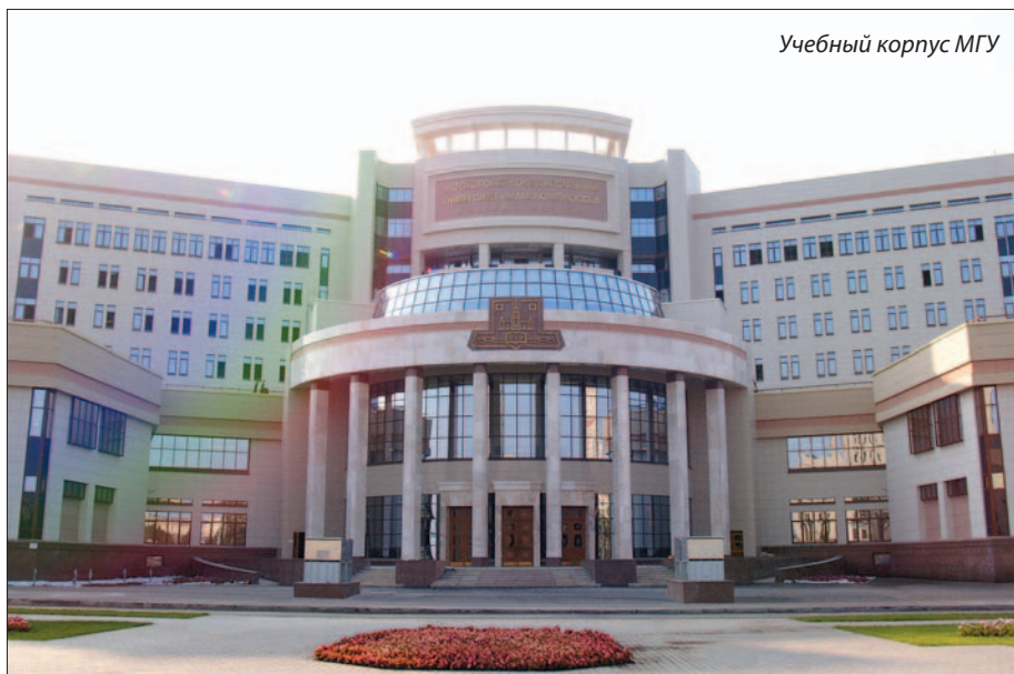
Учебный корпус МГУ

Культурно-просветительскую деятельность компания «Глобал Ривет» ведет в тесном тандеме с органами архитектурно-строительного надзора, которые в свою очередь проявляют живой искренний интерес к теме крепежа. Ведь тема сия как никогда актуальна и остра — рынок раздувается, как вселенная после Большого взрыва, а инфраструктура и правовая база крепежной отрасли находятся в состоянии