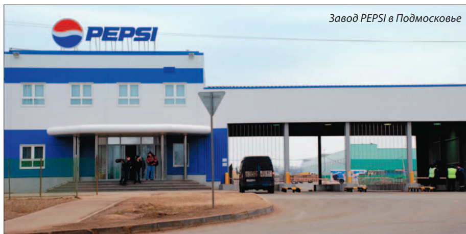
Завод PEPSI в Подмоскowie