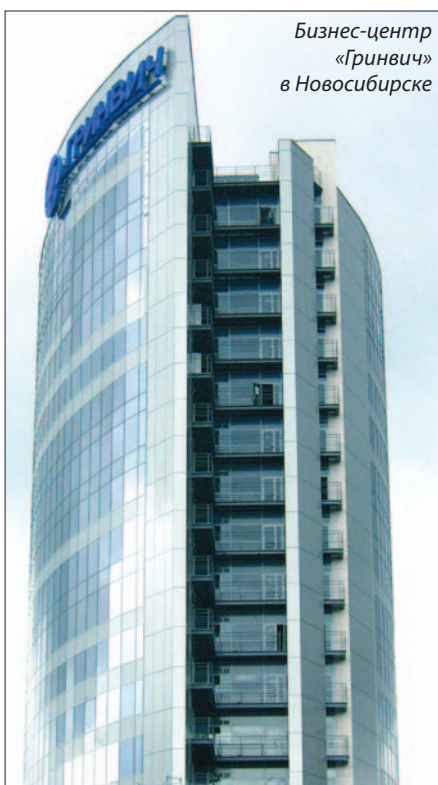
Бизнес-центр «Гринвич» в Новосибирске

Компания «Глобал Ривет» считает необходимым комплексное обслуживание своих клиентов не только в центре, но и в каждом отдельном регионе, где ценят качественный и надежный крепеж. Компания развивает сеть региональных представительств и предлагает своим партнерам выбрать наиболее подходящую форму сотрудничества в рамках договора дилерства, создания совместного предприятия или представительства. Региональное отделение компании будет представлять весь спектр продукции «Глобал Ривет», более оперативно и четко реагировать на запросы и выполнять заказы региональных клиентов. Мы верим: с нами будет вся Россия!