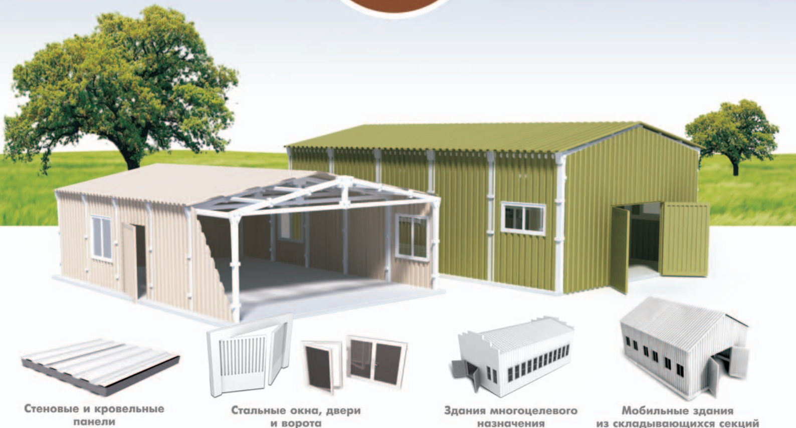
Стеновые и кровельные панели