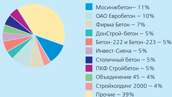
Крупнейшие участники рынка бетона Московского региона в 2007 г. по объемам выпуска продукции *