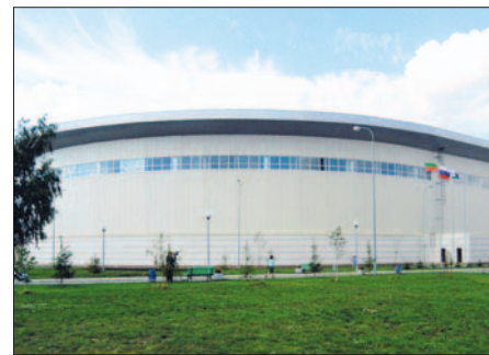
Легкоатлетический манеж (г. Казань)

Безусловно, эстетические достоинства системы THERMOPANEL сыграли отнюдь не маловажную роль при выборе именно продукции предприятия для возведения многих физкультурно-оздоровительных и спортивных объектов. В их числе два ледовых дворца в Санкт-Петербурге, современный спортивный комплекс в Уфе, крытый спортивный комплекс «МТЛ-Арена» в Самаре.